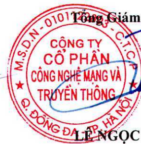
LE NGỌC TỬ